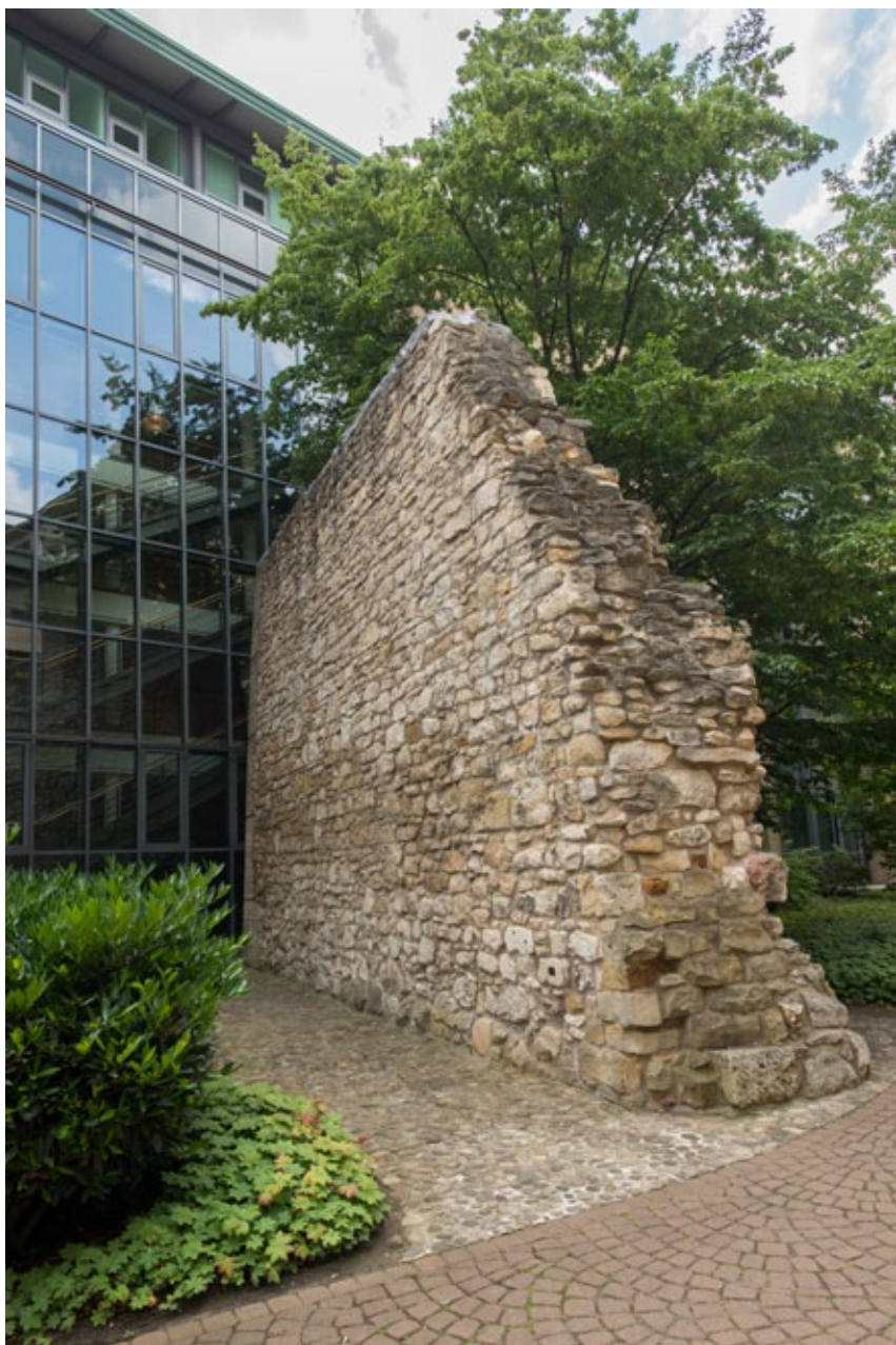
Blick auf die Außenfassade des Neubaus mit der historischen Stadtmauer